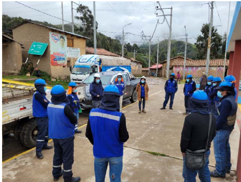
Charla 5min, y cumplimiento plan covid.