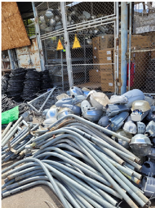
Entrega de Pastorales y Luminarias desmontados en alancen de Electro sur Este -Abancay.